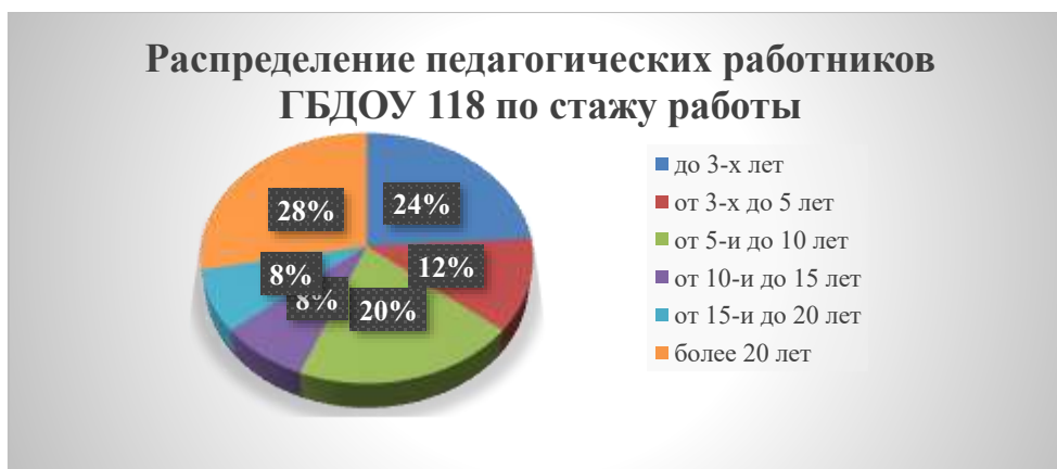
Рис. 2. Распределение педагогических работников ГБДОУ 118 по стажу работы

Распределение педагогических работников по уровню образования представлена на рис. 3. Высшую квалификационную категорию имеют 10 педагогических работников, 5 педагогических работников имеют первую квалификационную категорию.