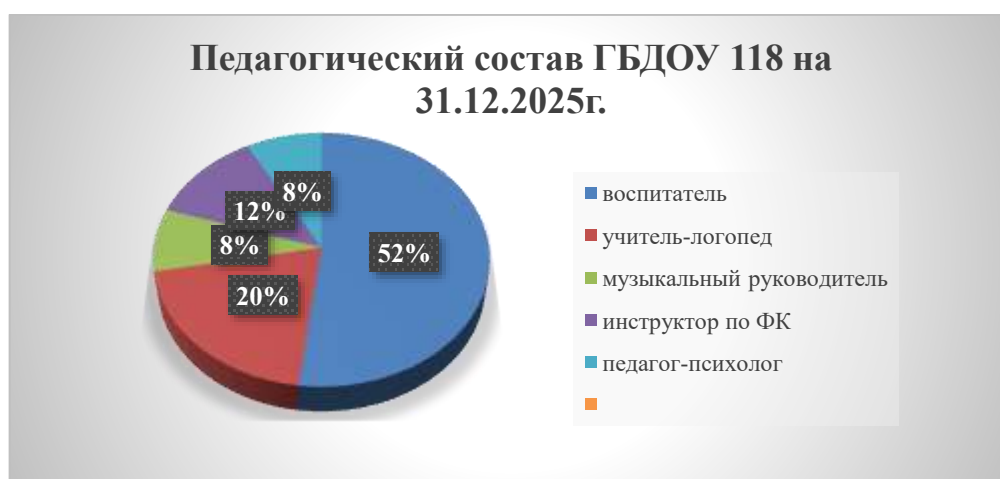
Рис. 1. Педагогический состав ГБДОУ 118

В образовательной организации в 2025г. штатное расписание предусматривает 70 штатных единиц: из них 31,50 штатных единиц составляют педагогические работники и 8,75 штатных единиц – учебно-вспомогательный персонал. Фактически занято на конец отчетного периода (31.12.2025г.) 23 ставки педагогических работников и 4 ставки учебно-вспомогательного персонала. Педагогический состав по состоянию на 31.12.2025г. представлен на рис. 1.